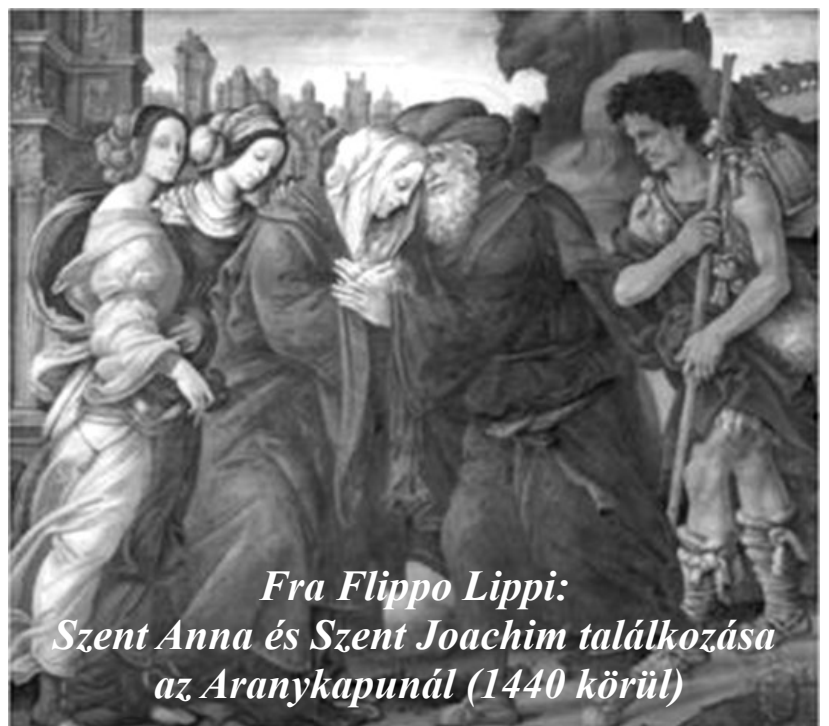
Fra Filippo Lippi: Szent Anna és Szent Joachim találkozása az Aranykapunál (1440 körül)

Istenünk, ki Szent Joachimot és Szent Anna asszonyt arra választottad, hogy tőlük szülessék Egyszülött Fiad édesanyja, az ő közbenjárásukra kérünk, add meg, hogy elnyerhessük az üdvösséget, melyet minden nép számára ígértél.