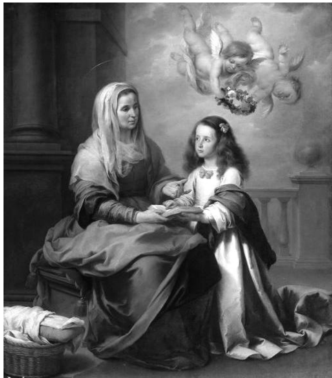
Murillo: Szent Anna tanítja Máriát (17. század)

A kerepesi római katolikus egyházközség lapja